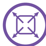
Purifie jusqu'à : 4 000 pi²