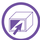
Installation : À l'intérieur d'un conduit