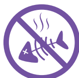
Élimine les odeurs et les contaminants chimiques