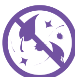
Élimine les composés organiques volatils (COV)